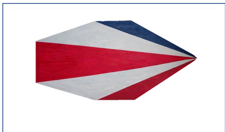
SUPボード用切削半加工品でDIY